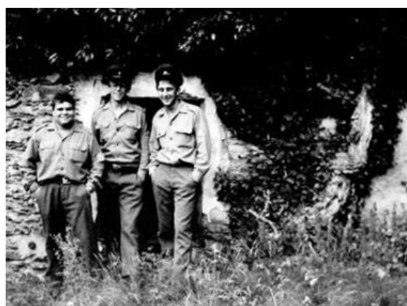
5. První fotografie břechťanu z počátku 20. století. 6. Za železnou oponou, rok 1984.