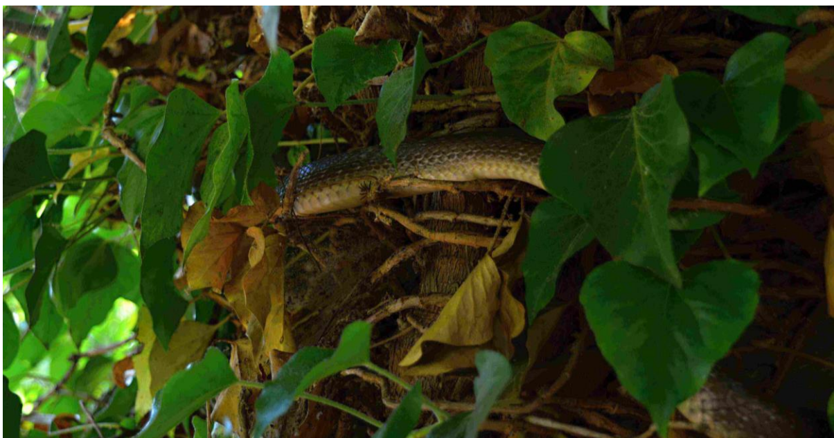
4. Mezi listy je občas možné zahlédnout vzácného hada užovku stromovou.