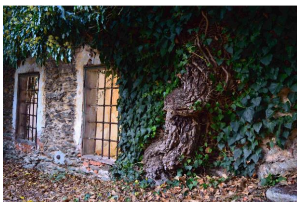
3. Mohutný kmen s obvodem přes 100 cm.