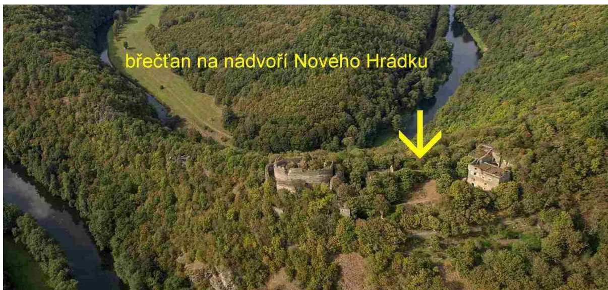
1. Letecký pohled na zříceninu Nového Hrádku u Lukova v Národním parku Podjeří.