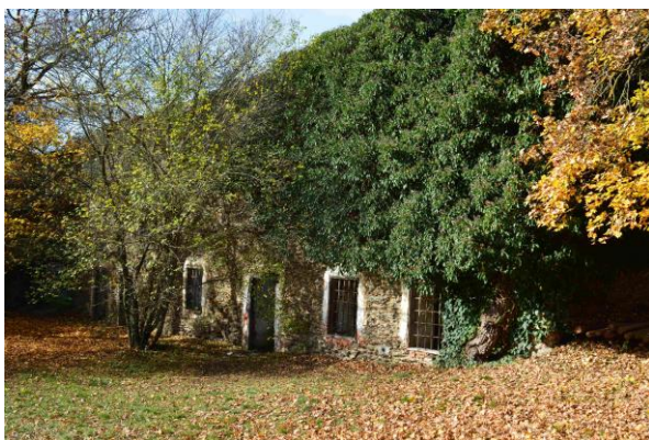
2. Břečťan na budově bývalé lesovny.