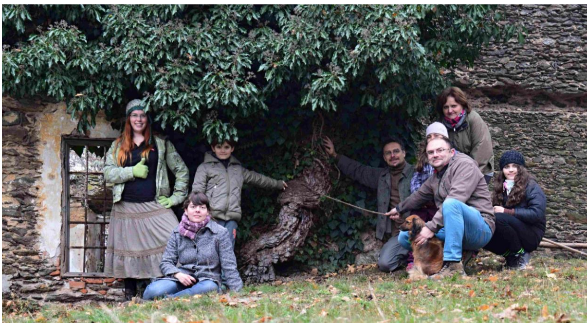
7. Novohrádečtí průvodci a návštěvníci při měření kmene v roce 2016.