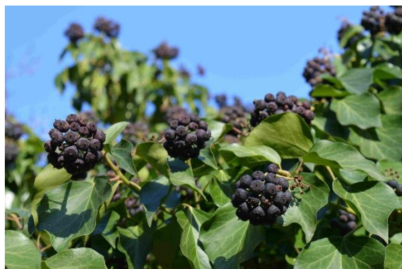
8. Tmavě modré plody dozrávají v zimě.

Další informace a fotografie naleznete na stránkách zříceniny: www.novy-hradek.eu .